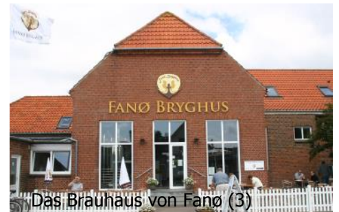
Das Brauhaus von Fanø (3)