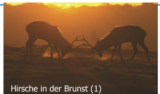
Hirsche in der Brunst (1)

Naturpark Nordsee ist ein Teil der 18 einzigartigen „Spot On“ Attraktionen in Südwestjütland. Weitere Informationen darüber finden Sie auf der Website www.sydvestjylland.com/spoton